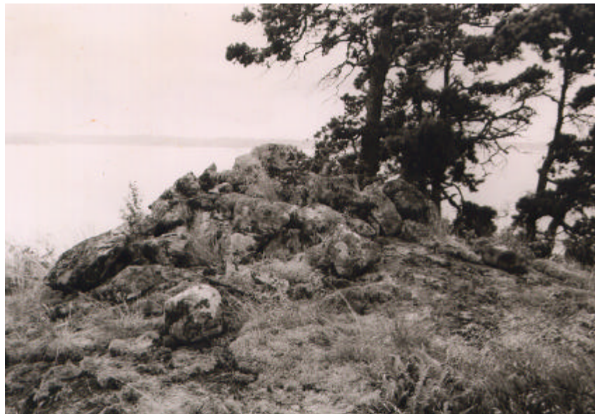
Röse vid Korpetorp. 1963.

Fornlämningsmiljön består av ett trettiotal röseliknande stensättningar. Gravarna är inte undersökta, men daterar sig förmodligen till bronsålder. Gravarna är anlagda på kalberget och flera av dem i monumentalt krönläge. Detta är en fornlämningsmiljö som är mycket ovanlig för Östergötland.