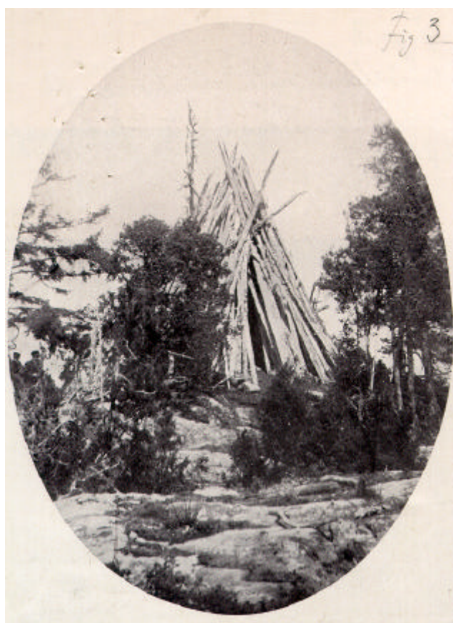
Östergötlands sista vårdkase. Efter fotografi 1915. Östergötlands länsmuseum.

Öster om fornlämningsmiljön ligger Lönshuvud, med en bevarad vårdkase på toppen av berget. Den är numera den enda bevarade vårdkasen i Östergötland. Sista gången vårdkasesystemet användes var år 1719, när ryssarna brände och härjade utmed östgötakusten. Därefter byggdes vårdkasen upp igen och det är troligt att delar av den nuvarande härrör från denna tid. Inuti vårdkasen finns gott om namnteckningar och initialer med datum och årtal, varav flera från 1800-talets senare hälft. Vårdkasen restaurerades 1972 och är nu fast fornlämning.