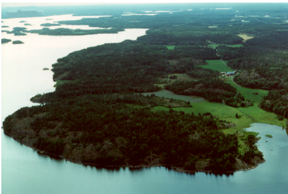
Flygfoto över riksintresset. 1991.

Kulturlandskapet i riksintresset består av en förkastningsbrant och kan karaktäriseras som ett orört kustlandskap. Branterna är skogsklädda med relativt öppen skog, bestående av omväxlande barr- och lövträd. Förkastningsbranten stupar ned i Lönshuvudfjärden och från bergets topp har man en vidsträckt utsikt över S:t Annas skärgård.